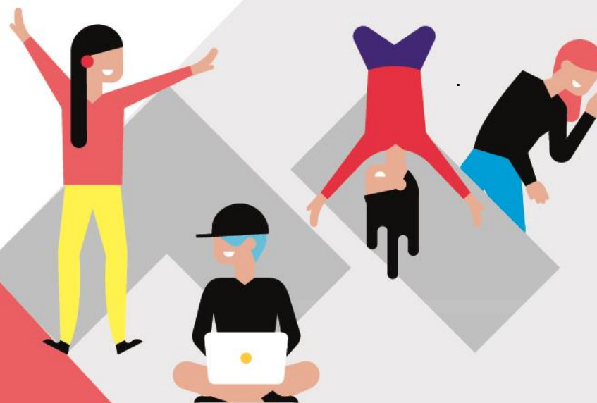
Illustration : freepik.fr / design graphique : christellebougne.fr